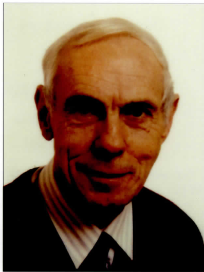
Begr. Van Vije - Lottegem